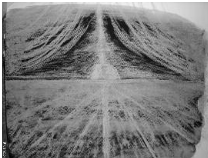
Beispiel zeichnerischer Umsetzungen von seelischem Beobachten in der Natur durch Teilnehmer des Seminars

Erstens das Sich-Einstimmen in Form einer Staunens- oder Verehrungsstimmung. Zweitens die reine Beobachtung/Wahrnehmung: Was habe ich mir gegenüber? Wir betrachteten welches Laub und eine kräftig wachsende Fettblattpflanze. Drittens das Krafterleben: Welche Kräfte kommen mir entgegen, welche Kräfte offenbaren sich im Sprießen beziehungsweise Welken? Aus dem Krafteindruck entsteht viertens ein Gefühl in der Seele. Dieses, wie Rudolf Steiner schreibt, huscht durch die Seele und ist so flüchtig, dass es oft unbemerkt bleibt. Zu üben ist, dieses Gefühl «am Schopf zu greifen» und im fünften Schritt zu halten. Ist dies geglückt, muss es sechstens verstärkt werden. Hier wird deutlich, was mit «seelischem Beobachten» gemeint ist: So wie in der «Philosophie der Freiheit» das Denken als Beobachtungsgegenstand untersucht wird, ist die Methode von «Wie erlangt man Erkenntnisse der höheren Welten?», die Gefühle hervorzubringen und zu betrachten. Der Gefühlseindruck wird Objekt der Beobachtung. Das ursprünglich Beobachtete aus der Natur (etwa ein welches Blatt) ist nicht der Meditationsinhalt, es dient, um durch Betrachtung das «dahinter» liegende Ätherische,